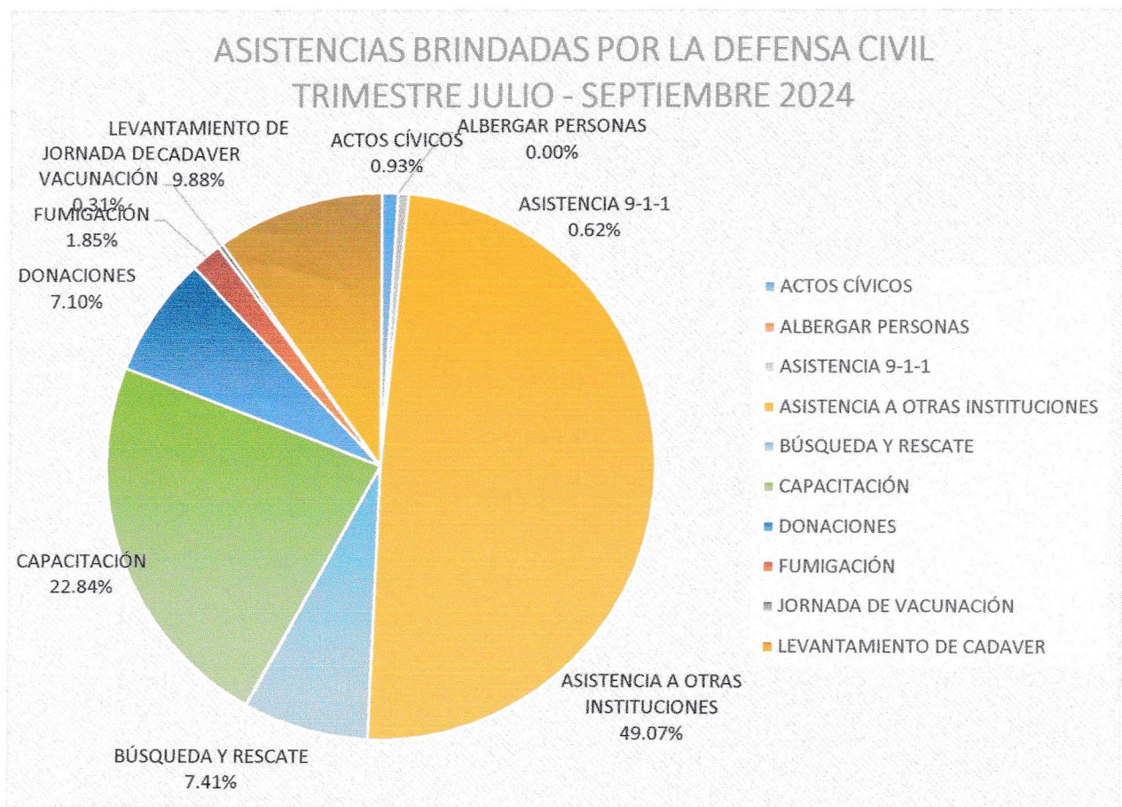
Ilustración 1. Incidencias asistidas por Defensa Civil Tercer Trimestre 2024

En este periodo, la Defensa Civil brindó asistencia a un total de DOSCIENTOS SETENTA VEINTIDOS (270) incidencias y acciones, cubiertas por miembros de la Defensa Civil. Las mismas se desglosarán en los gráficos a continuación.